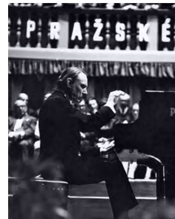
Arturo Benedetti Michelangeli