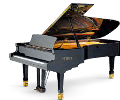
Nová generace klavírů