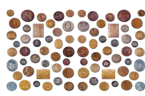
Medaile značky PETROF